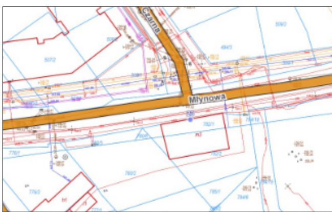
Sytuacja, skala 1:500; Działka 782/2 jest własnością Gminy Białystok;

Lokalizacja. Budynek wzniesiony został kalenicowo do ulicy Młynowej, po jej południowej stronie, na wprost ul. Czarnej. Usytuowany jest na dwóch działkach o łącznej powierzchni 0,0557ha (numery działek: 782/1 O.74 i 782/2, Ob.88,) bezpośrednio przy ulicy. Działka nie jest ogrodzona i nie posiada innych zabudowań.